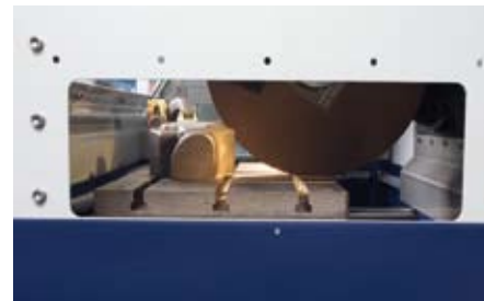
Les ouïes transparentes latérales peuvent être relevées pour le passage des pièces longues