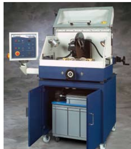
Meuble en option permettant la mise en place des différents bacs de recirculation. L'ouverture du capot reculée permet une ergonomie de travail parfaite et évite les coulures de liquide de coupe lors des bridages et débridages des pièces.

Pour plus de détails sur les accessoires et consommables, merci de nous contacter ou de vous référer au catalogue consommables et machines. Les produits Buehler sont continuellement améliorés, nous nous réservons le droit de changer nos produits sans avis préalable.